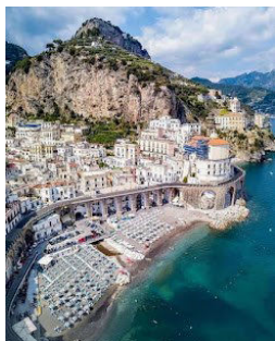
Progetto grafico Stampato in proprio